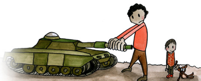
Tu as le droit d'être protégé contre la guerre

Si tu appartiens à une minorité ethnique, religieuse