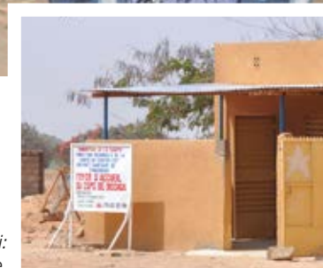
Le foyer de Bissiga a déjà bien servi: 24 femmes y ont séjourné depuis son ouverture.