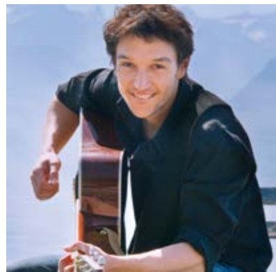
Le chanteur «K» est convaincu par la pertinence du projet et apprécie d'aller à la rencontre des enfants.

nement ou la paix dans le monde pourraient être atteint plus facilement si chaque enfant bénéficiait d'une éducation de qualité. Mais 69 millions d'enfants n'y ont pas encore accès.» C'est la raison pour laquelle il soutient avec conviction ce projet: «Proposer aux élèves de réfléchir à cette question, puis de composer et d'enregistrer une chanson pour donner leur avis et soutenir des écoles au Burkina Faso, je trouve ça fantastique.»