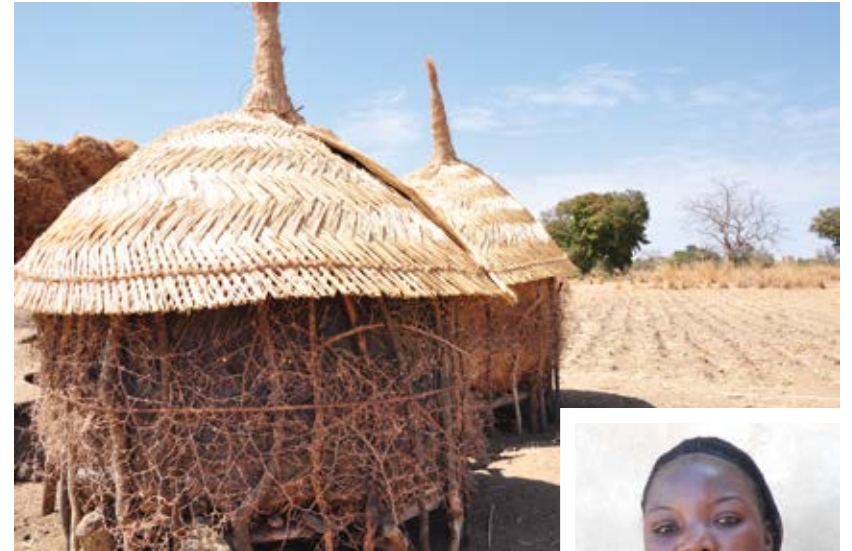
Dans ces régions rurales au Burkina Faso, la majorité de la population vit de l'agriculture et de l'élevage. Ici, des greniers à mil.